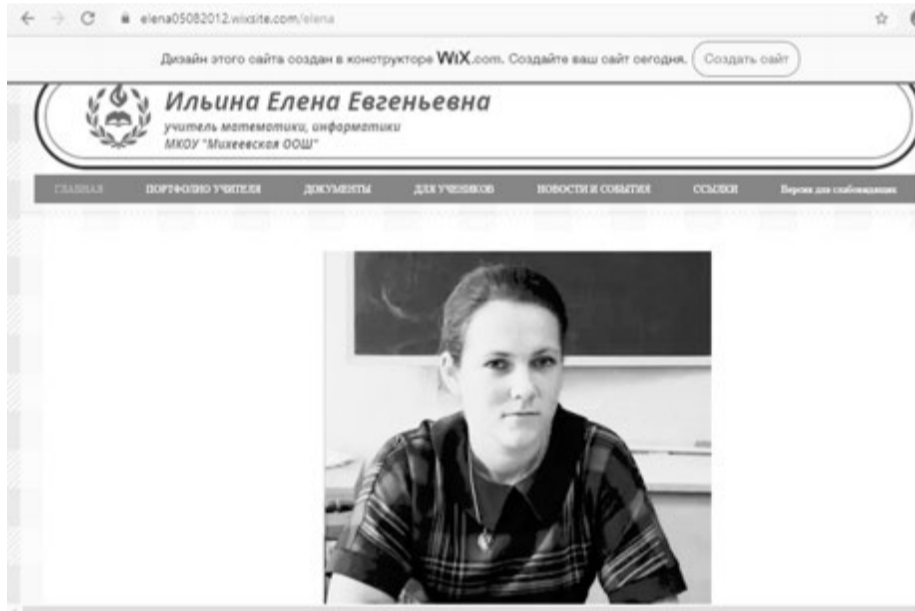
Личный сайт автора статьи

Сервис удобен тем, что на нем можно хранить достаточно объемные презентации, которые снабжены анимацией и гиперссылками. Можно скачивать презентации других пользователей. Созданная презентация практически моментально публикуется в сети Интернет.